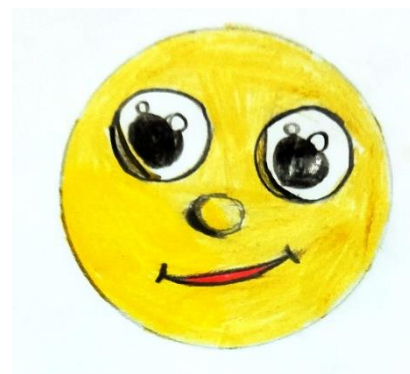
Ilustrácia: Dorotea Pjataková, VI.A

„Nevidíš, veď tam sedí nejaký pán s kávou a vedľa neho stojí krava.“